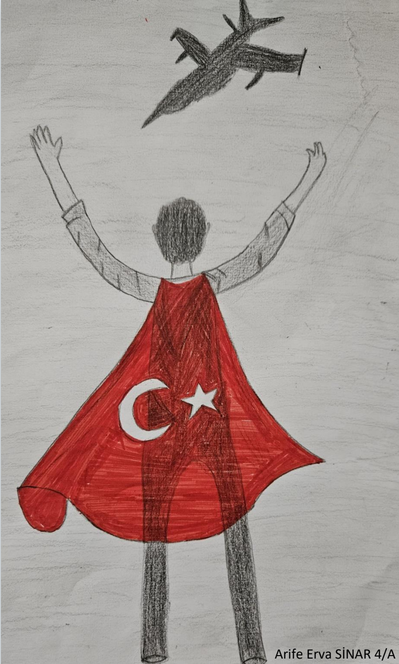
Arife Erva SİNAR 4/A